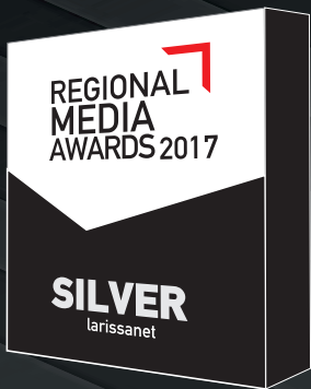
Best Cover / Headlines