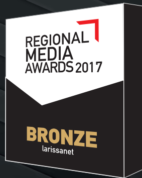
Best website (paper.larissanet)