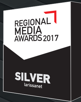
Best Responsive site