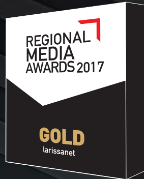
Cross Platform Content