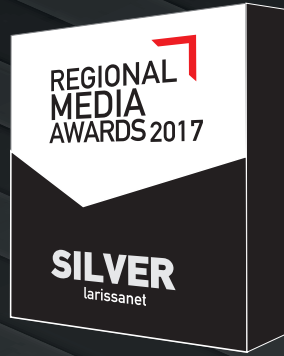
Product / Printing Quality