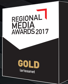
Tablet & Smartphone