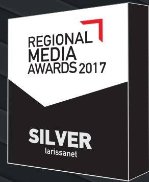
Best Public Interest