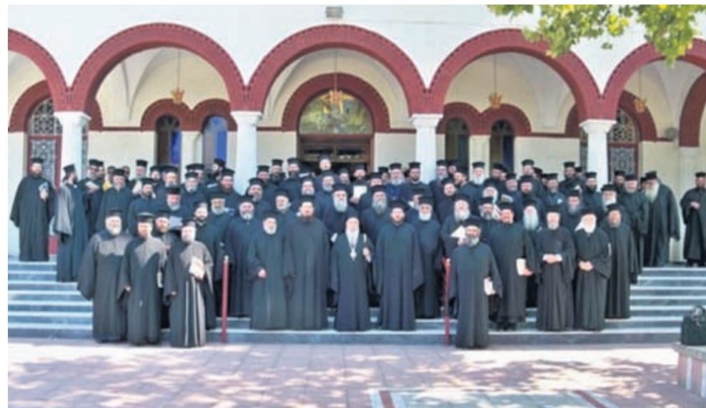
Από την πρώτη σύναξη ιερέων της Ιεράς Μητρόπολης Λαρίσης