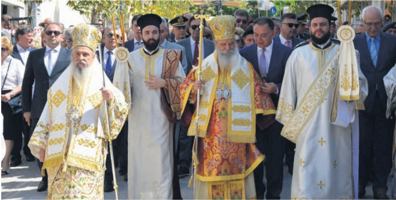
Από τις λαμπρές εκδηλώσεις για τον Πολιούχο της Λάρισας, Άγιο Αχίλλιο