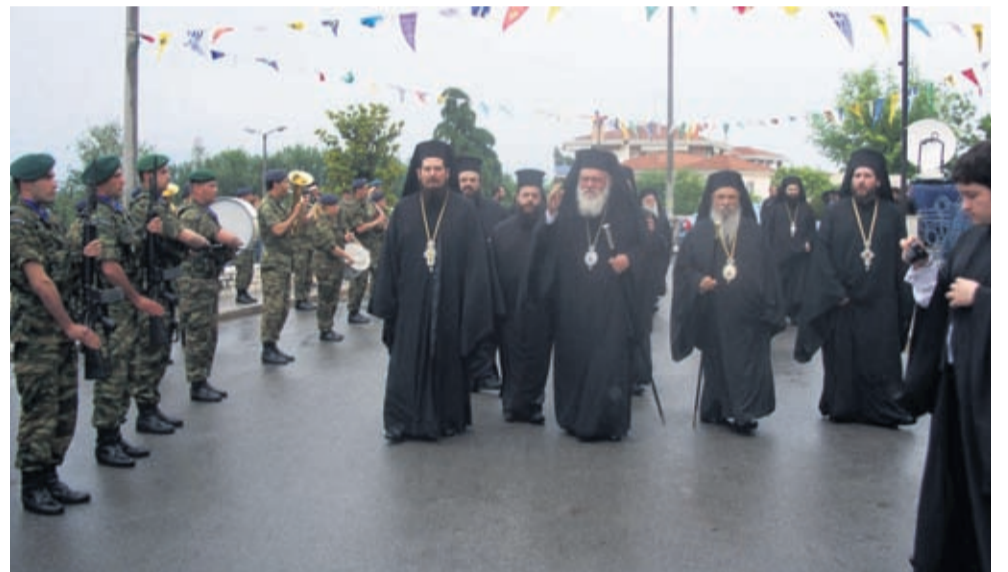
Με τον Αρχιεπίσκοπο Ιερώνυμο στον αύλειο χώρο του Αγίου Ακαλίου Λαρίσης

Την τελευταία 25ετία σφράγισε με το έργο του ο Μητροπολίτης Λαρίσης και Τυρνάβου Ιγνάτιος