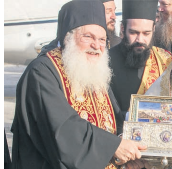
Από την υποδοχή της Αγίας Ζώνης στην 110 Π.Μ.