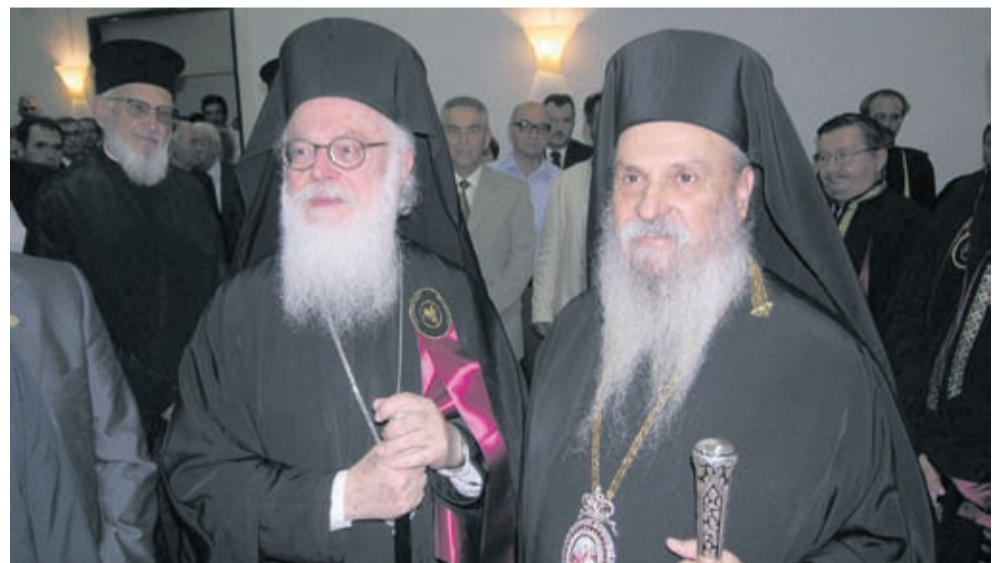
Στο Πανεπιστήμιο Θεσσαλίας με τον Αρχιεπίσκοπο Αλβανίας Αναστάσιο