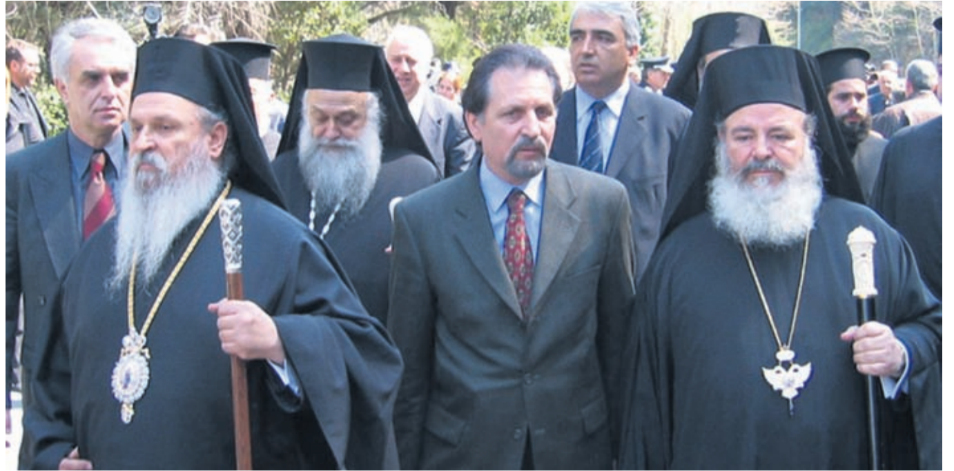
Με τον Μακαριστό Αρχιεπίσκοπο Αθηνών Χριστόδουλο