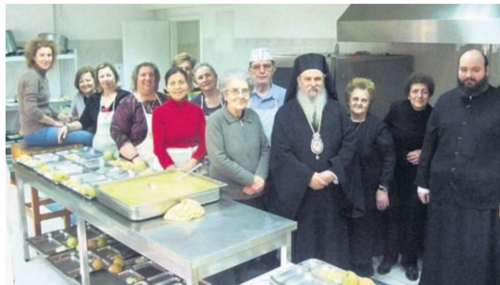
Με τους εθελοντές στα σουσιτσια απόρων του Ιδρύματος «Ο Επούσιος»