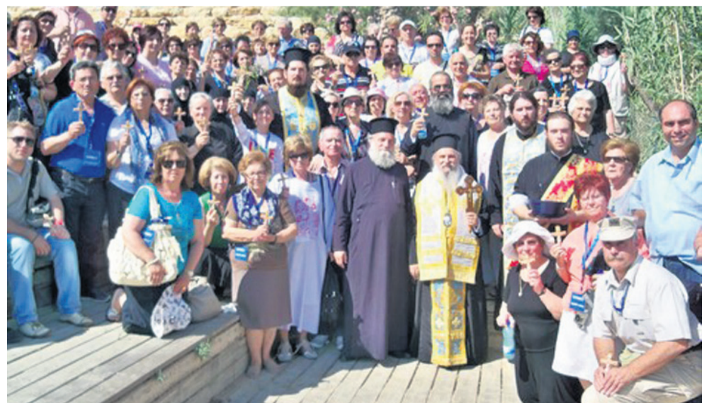
Από την προσκυνηματική εκδρομή στους Αγίους Τόπους