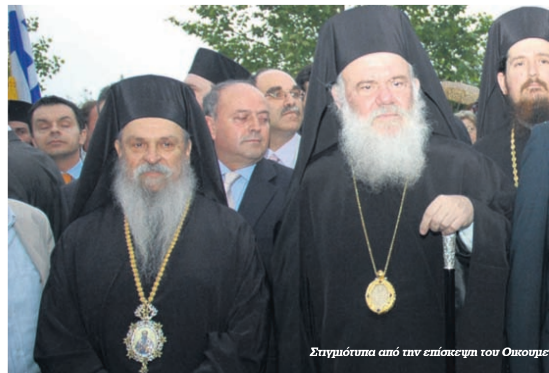
Στηγμότητα από την επίσκεψη του Οικουμ...