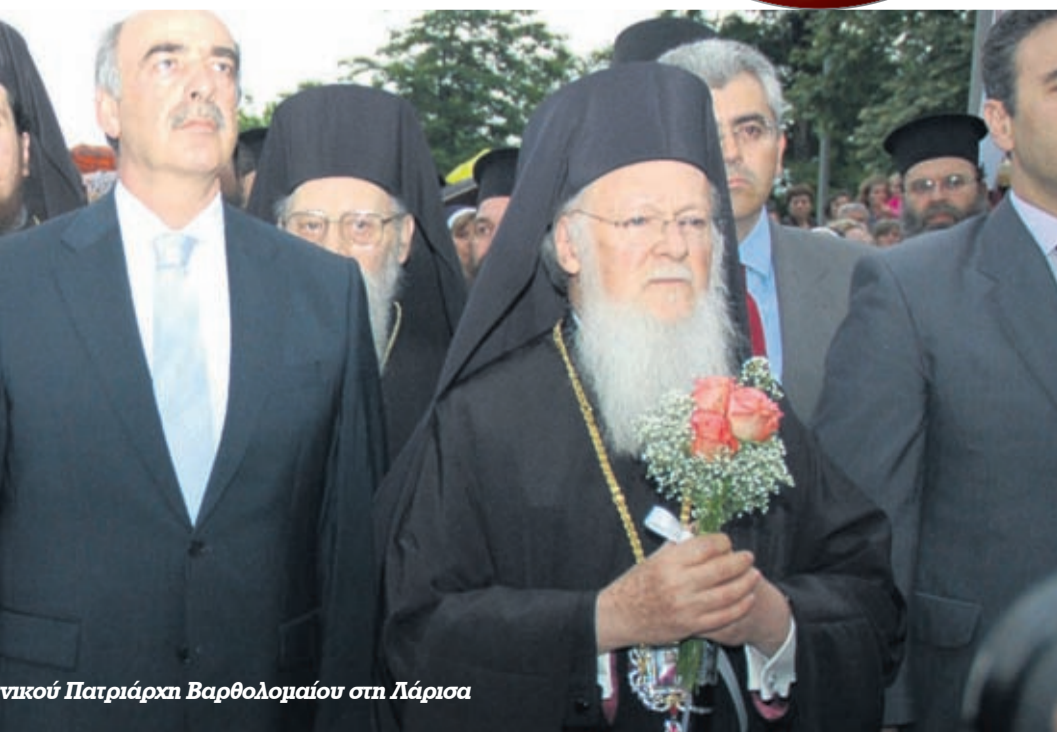
Πατριάρχη Βαρθολομαίου στη Λάρισα