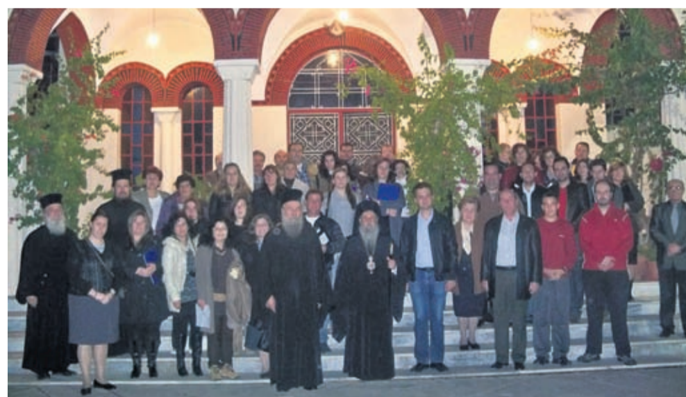
Δίπλα στη νεολαία της Λάρισας