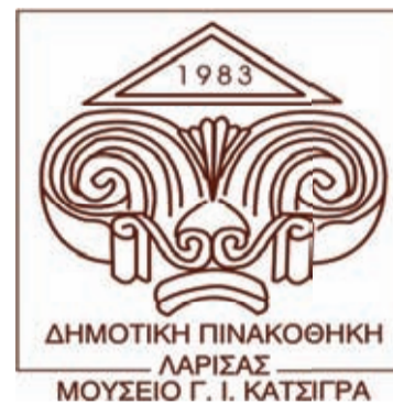
ΔΗΜΟΤΙΚΗ ΠΙΝΑΚΟΘΗΚΗ ΛΑΡΙΣΑΣ ΜΟΥΣΕΙΟ Γ. Ι. ΚΑΤΣΙΓΡΑ

Για περισσότερες πληροφορίες (κατά τη διάρκεια των εγγραφών) μπορείτε να απευθύνεστε καθημερινά από Δευτέρα έως Παρασκευή 11:00 - 13:00 και 18:00 - 21:00 στη Γραμματεία του Εργαστηρίου στο κτίριο της Πινακοθήκης στη Νεάπολη και στο τηλέφωνο 2410 670 496.