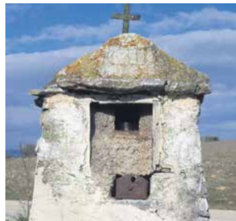
Το εικονοστάσι πριν από την είσοδο του Βοτανοχωριού

Οι Γκριτζοβαλίτες είχαν στενότερους δεσμούς με την Ελασσόνα και κυρίως με την Μονή της Ολυμπώτισσας, όπως προκύπτει από την αναφορά δύο μοναχών στην ως άνω μονή: του Δανιήλ Γκριτζοβαλίτη, ο οποίος αναφέρεται ως ηγούμενος της Ολυμπώτισσας το το έτος 1768 5 και το 1796 ένας άλλος μοναχός Γκριτζοβαλίτης,