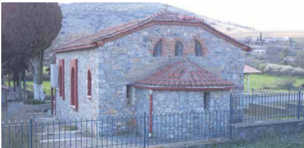
Ο ναός του Αγ. Νικολάου στο Βοτανοχώρι, από τα ανατολικά