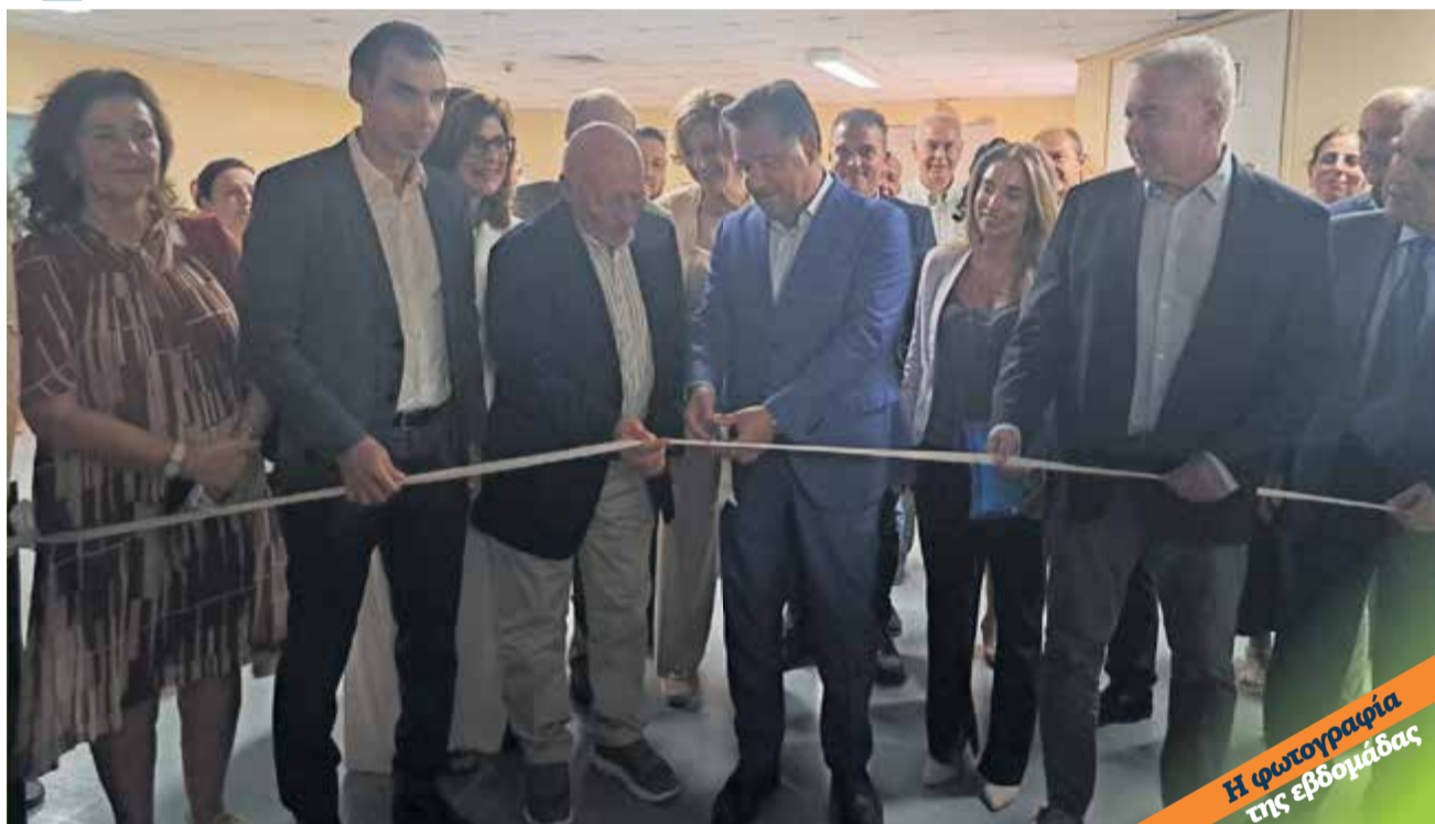
Εγκαινιάστηκε η ΜΕΘ Παιδών «Φανή Καντώνια» στο Πανεπιστημιακό, Σωρεά του Ξενοφών Καντώνια...

Ποιος δήμαρχος της ΠΕ Λάρισας δεν ανακοίνωσε ούτε ένα νέο έργο;