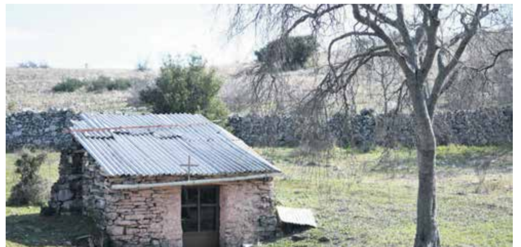
Ερείπια από το παλιό Ιερό του Προφήτη Ηλία