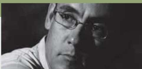
Του Αντώνη Ψάλτη

Βιβλιογραφία: τα δύο έργα του Πλάτωνος, «Τίμαιος» και «Γοργίας».