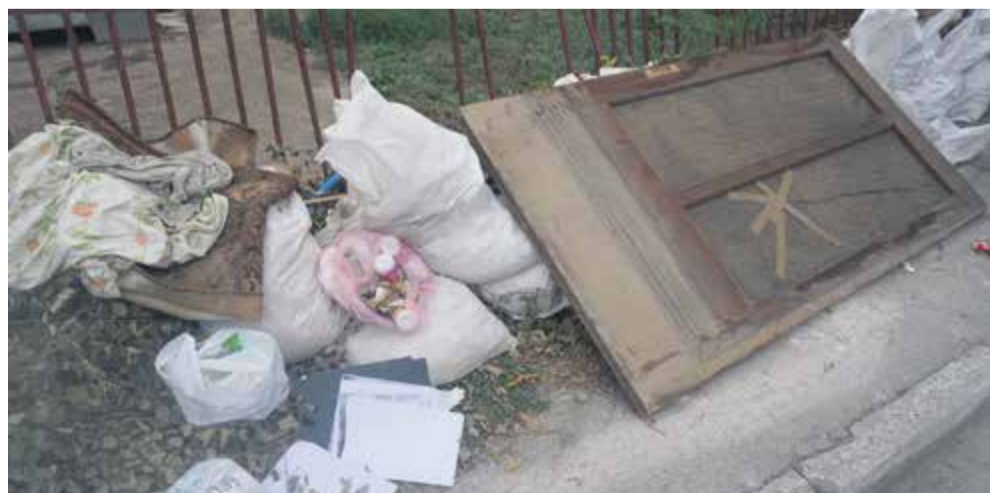
Πλημμυροπαθείς - Άγιος Θωμάς

Οι άνθρωποι έχουν χάσει την ελπίδα τους κι αυτό είναι από τα χειρότερα πράγματα που μπορούν να συμβούν σε κάποιον. Όσα τους έχουν πει ότι θα γίνουν – όπως μας λένε – είναι με ορίζοντα 10ετίας τουλάχιστον. «Τον ψυχολογικό παράγοντα ποιος τον υπολογίζει; Δεν θα έπρεπε να υπάρχει πρόνοια για όλους εμάς που έχουμε υποστεί αυτές τις ζημιές; Την προηγούμενη εβδομάδα έβρεχε δυνατά και με έπασε ταχυπαλμία. Έρχονται ξανά οι μνήμες εκείνων των ημερών. Όποτε βρέχει πλέον είμαστε μέσα στο άγχος».