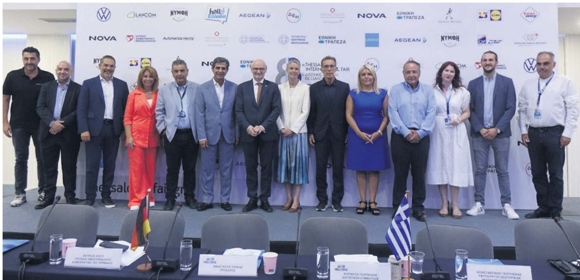
Από την παρουσίαση της 88ης ΔΕΘ