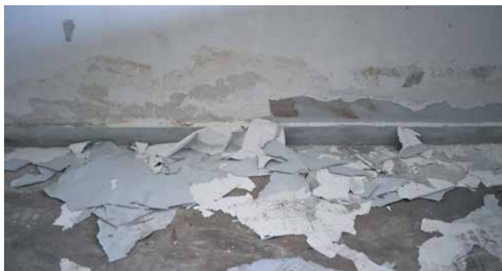
Εργατικές Κατοικίες Γιάννουλης

Η ζωή επιστρέφει αλλά με πρωτοβουλία των κατοίκων – Εργατικές Κατοικίες Γιάννουλης και συνοικία Αγίου Θωμά σε μεγάλη αβεβαιότητα για το μέλλον