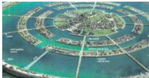
Υποθετικές απεικονίσεις της Ατλαντίδος

έναν λόφο που περιέβαλαν 3 κυκλικά κανάλια (δες το σχέδιο). Μπορούσε κάποιος να βρει όλα τα είδη ξυλείας. Υπήρχε μεγάλη ποικιλία από ήμερα και άγρια ζώα, καθώς και ένα κοπάδι ελέφαντες. Υπήρχαν ακόμη φυτά, χορταρικά, μυρωδικά, κλωροί και ξηροί καρποί, δημητριακά, όσπρια και ό,τι άλλο μπορεί να φυτρώνει σε μία ευλογημένη γη. Χάρη στην κατασκευή μεγάλων τεχνικών έργων, κατάφεραν να έχουν δύο σοδειές το χρόνο.