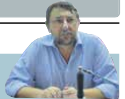
Γράφει ο Γιώργος Σούλτας